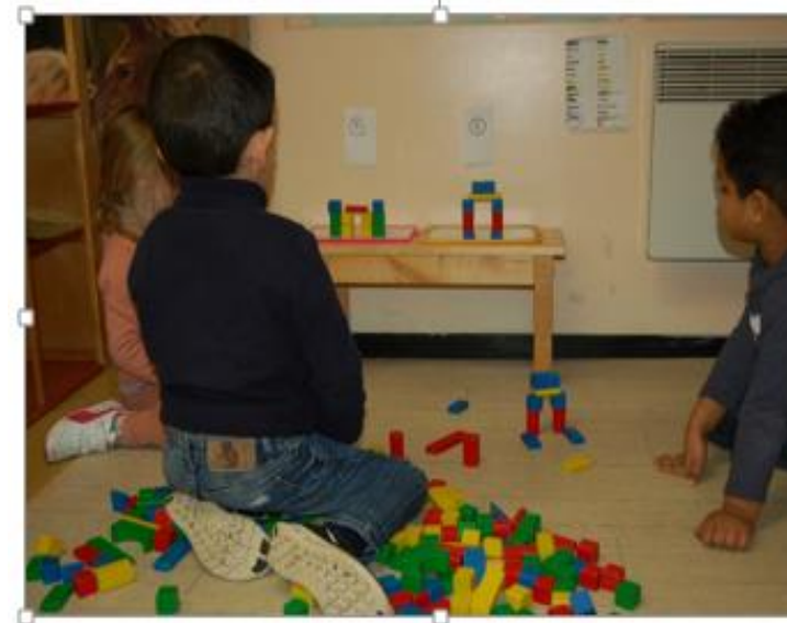
Espace « construction »