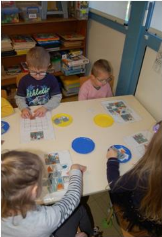
Espace « Premiers outils »