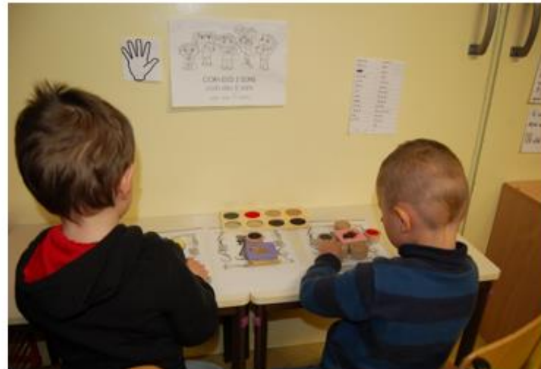
Espace « sensoriel »