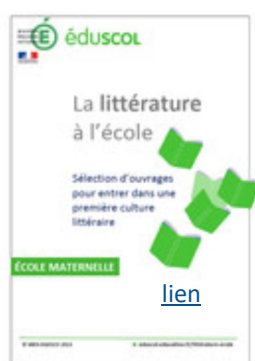
La liste des ouvrages recommandés 2020

https://eduscol.education.fr/cid91996/mobiliser-le-langage-dans-toutes-ses-dimensions.html