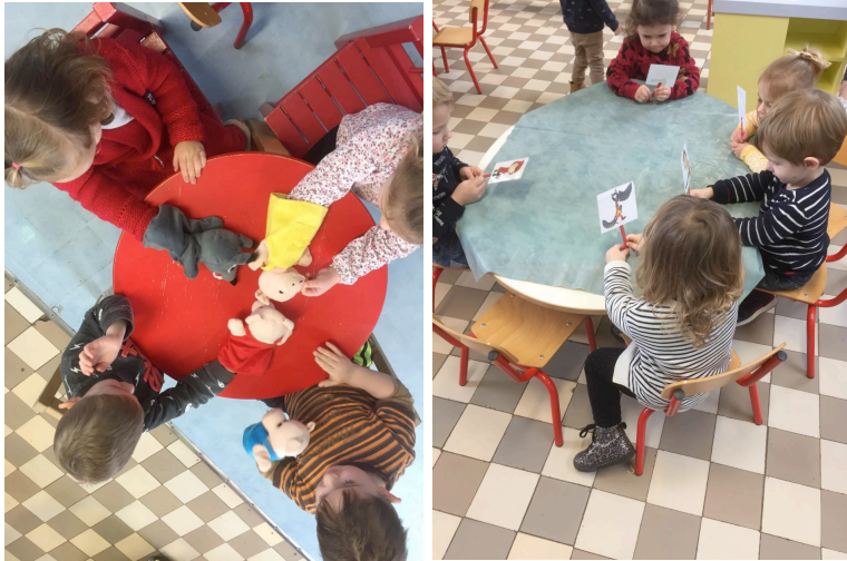
Mimer, théâtraliser les contes et les albums entendus