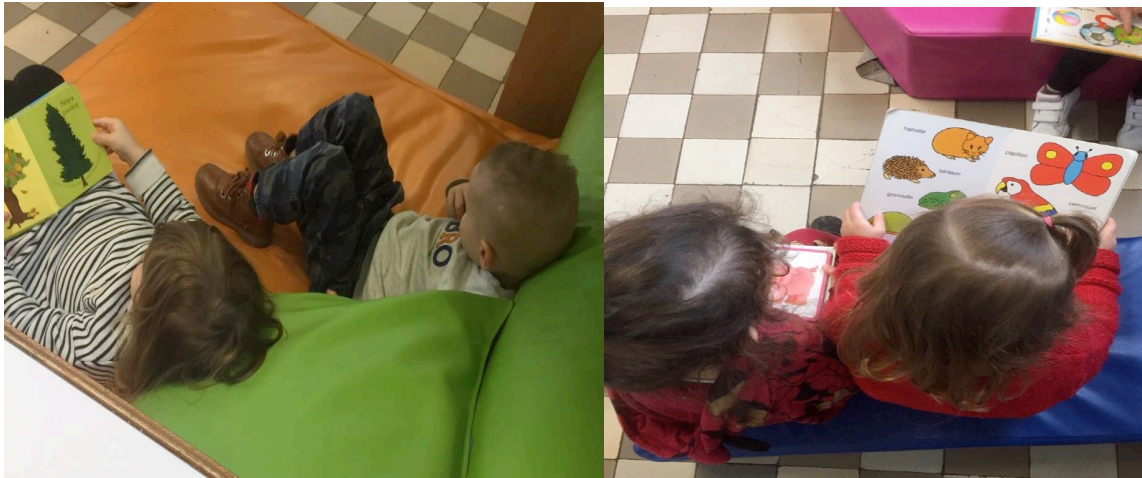
Un espace de repli dans la classe de TPS/PS pour accueillir les premiers enfants réveillés

L'objectif est de rendre l'enfant le plus autonome possible pour les gestes de la vie quotidienne.