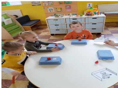
Réinvestir le vocabulaire appris

C'est le moment de l'après-midi où la concentration et l'attention sont optimales. Les enseignantes proposent des activités à haut coût cognitif comme des jeux d'écoute active, des activités de rappel de récit, des séances structurées d'apprentissage du vocabulaire, des activités de stimulation langagière.