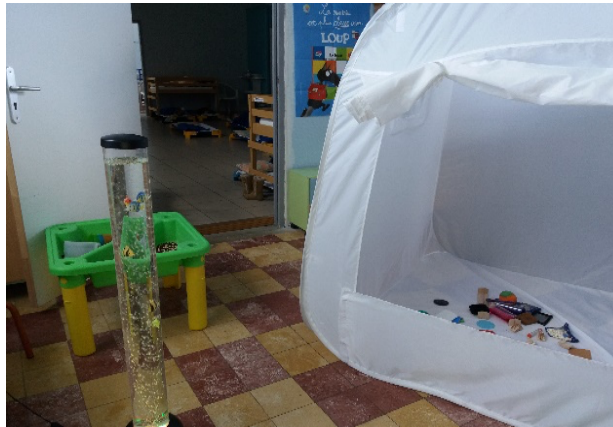
Un nouvel « espace zen » à côté du dortoir