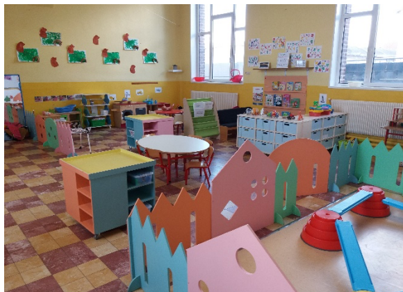
Une classe de TPS/PS