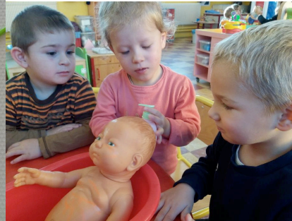
Les espaces d'imitation au service de l'apprentissage du vocabulaire