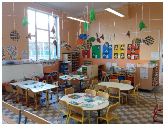
Une classe de PS/MS