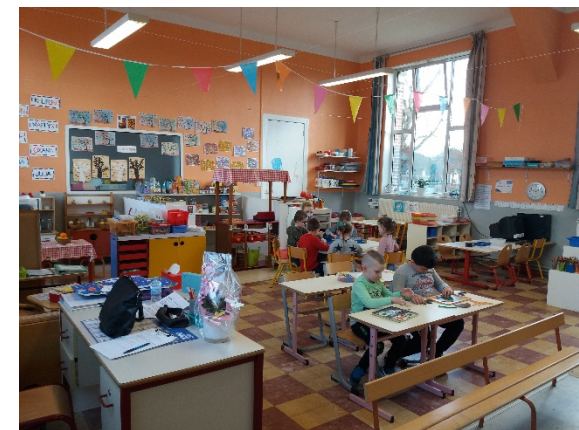
Une classe de GS à effectif réduit