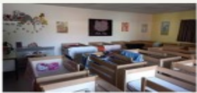
École Basly - Sallaumines - circonscription d'Avion