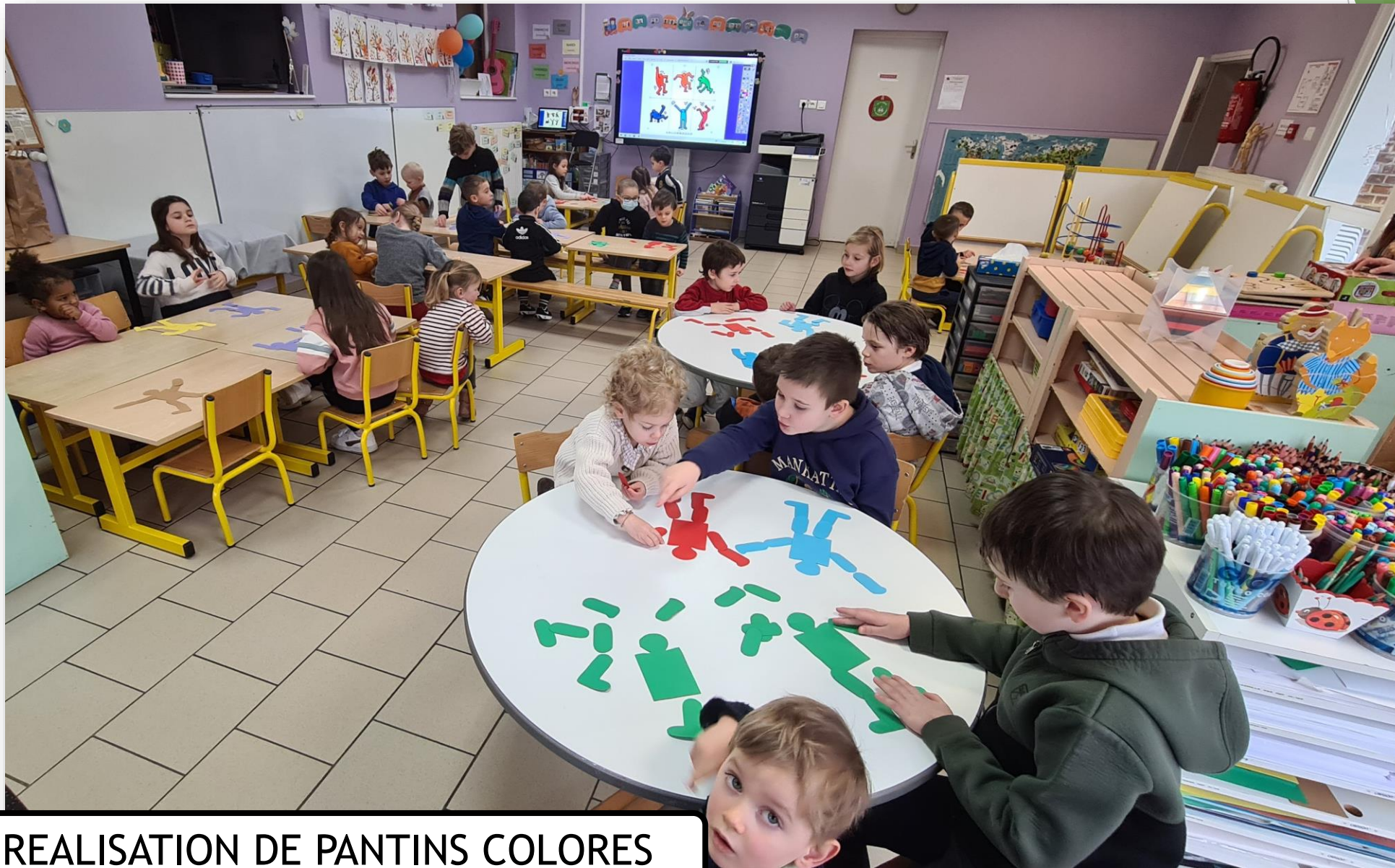
REALISATION DE PANTINS COLORES